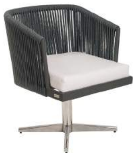
POLTRONA FLORENÇA GIRATÓRIA CORDA BASE ESTRELA L61 P62 A80 Estrutura em alumínio e acabamento em corda. náutica.