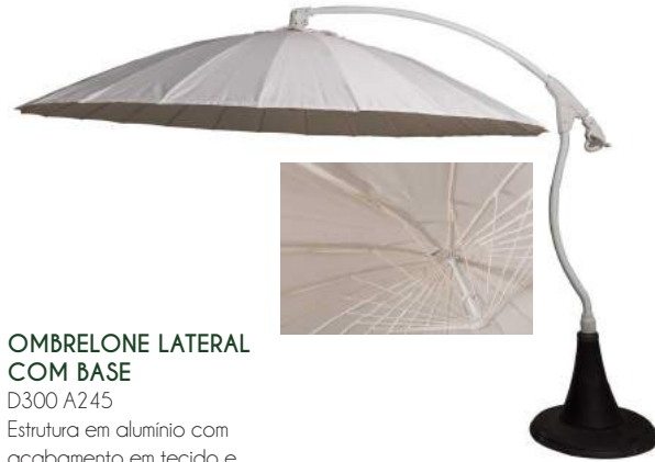
OMBRELONE LATERAL COM BASE D300 A245 Estrutura em alumínio com acabamento em tecido e base plástica cimentada.