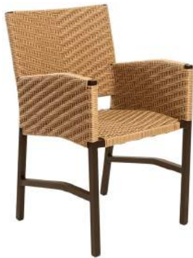
CADEIRA CARAÍVA COM BRAÇO FIBRA L53 P60 A90 Estrutura em alumínio com acabamento em fibra sintética.