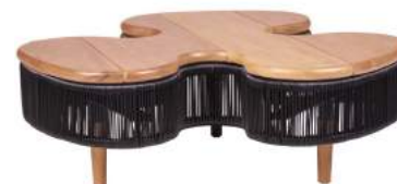
MESA DE CENTRO FLORENÇA FIBRA L102 P102 A35 Estrutura em alumínio com tampo semiliso em madeira Cumaru e fibra sintética.