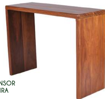
APARADOR EXTENSOR MÔNACO MADEIRA L120 P40 A85 Estrutura em madeira Cumaru.