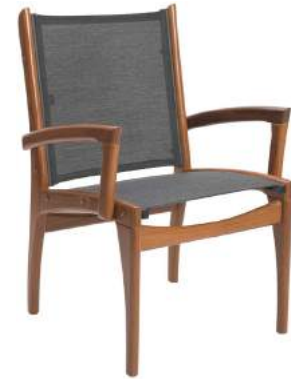
CADEIRA FENDI COM BRAÇO TELA L60 P61 A90 Estrutura em madeira Cumaru e acabamento em alumínio com tela sling.