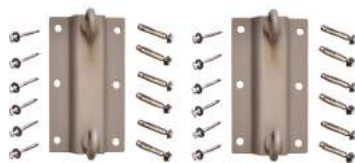
SUPORTE DE TETO 2 ENGATES L20 P11 A08 Estrutura em ferro galvanizado. Acompanha 02 suportes, 12 parafusos para fixação em madeira maciça e 12 parafusos para fixação em concreto.