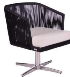
POLTRONA FLORENÇA GIRATÓRIA FIBRA BASE ESTRELA L61 P62 A80 Estrutura em alumínio e acabamento em fibra sintética.