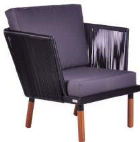
POLTRONA FLORENÇA FIBRA L76 P75 A71 Estrutura em alumínio com acabamento em madeira Cumaru e fibra sintética.