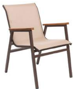
CADEIRA ITAPOÁ TELA L56 P75 A87 Estrutura em alumínio com acabamento em madeira Cumaru e tela sling.