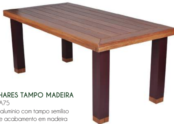
MESA LINHARES TAMPO MADEIRA L180 P100 A75 Estrutura em alumínio com tampo semiliso com borda e acabamento em madeira Cumaru.