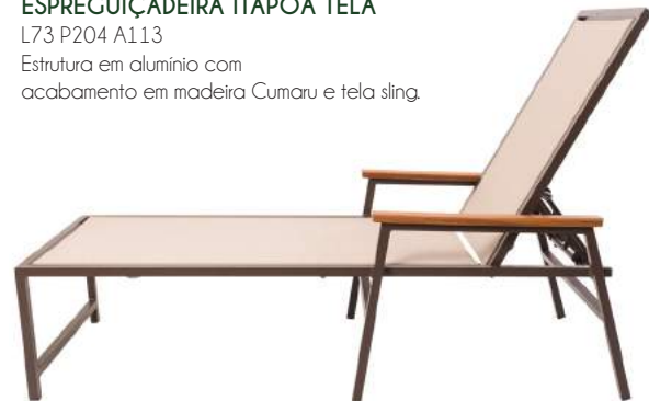
ESPREGUIÇADEIRA ITAPOÁ TELA L73 P204 A113 Estrutura em alumínio com acabamento em madeira Cumaru e tela sling.