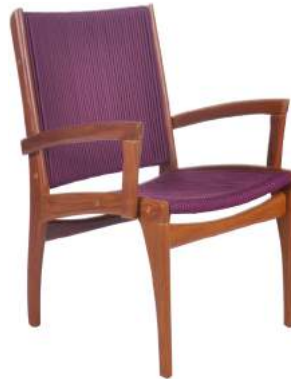
CADEIRA FENDI COM BRAÇO CORDA L60 P61 A90 Estrutura em madeira Cumaru e acabamento em alumínio com corda náutica.