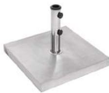
BASE PARA OMBRELONE EM INOX 30 KG L48 P48 A37 Estrutura em aço inox cimentada.