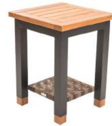
MESA LATERAL LINHARES FIBRA E TAMPO MADEIRA L45 P45 A60 Estrutura em alumínio, tampo ripado com borda e acabamento em madeira Cumaru.