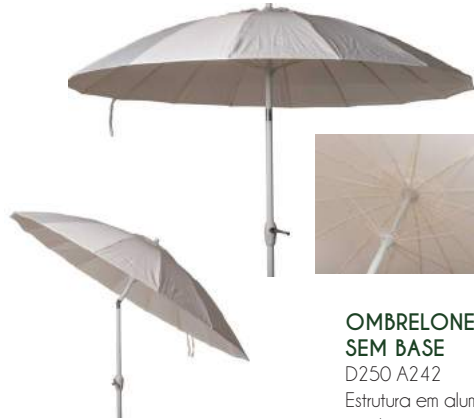
OMBRELONE CENTRAL SEM BASE D250 A242 Estrutura em alumínio com acabamento em tecido.