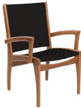
CADEIRA FENDI COM BRAÇO FIBRA L60 P61 A90 Estrutura em madeira Cumaru e acabamento em alumínio com fibra sintética.