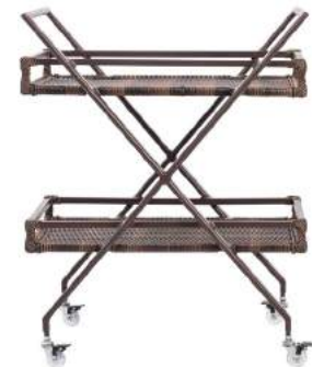
CARRO DE CHÁ CAMÉLIA FIBRA L48 P68 A82 Estrutura em alumínio com acabamento em fibra sintética.