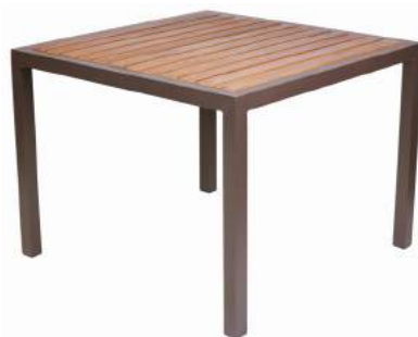
MESA ITAPOÁ TAMPO MADEIRA L100 P100 A75 Estrutura em alumínio com tampo ripado em madeira Cumaru.