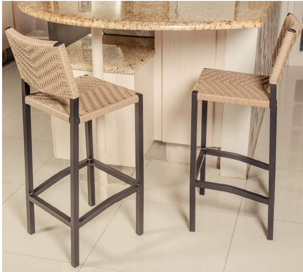
BANQUETA CARAÍVA A70 FIXA FIBRA L40 P45 A100 Estrutura em alumínio e acabamento em fibra sintética.