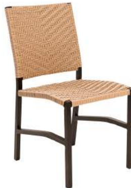
CADEIRA CARAÍVA FIBRA L47 P60 A90 Estrutura em alumínio com acabamento em fibra sintética.