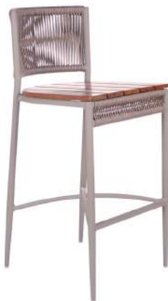
BANQUETA LONDRES A70 FIXA CORDA L43 P50 A98 Estrutura em alumínio com acabamento em madeira Cumaru e corda náutica.