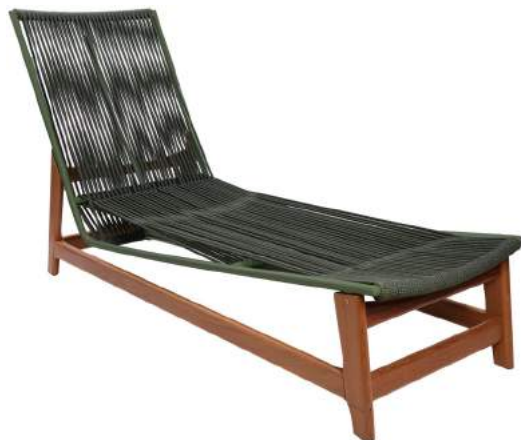
ESPREGUIÇADEIRA TURIM CORDA L63 P187 A97 Estrutura em madeira Cumaru com acabamento em alumínio e corda náutica.